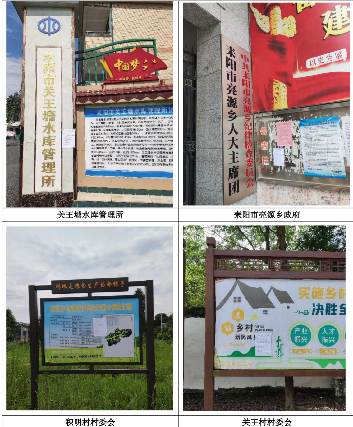
图5 征求意见稿现场公示照片

本公司于2024年7月26日通过现场公示的方式，在关王塘水库管理所、亮源乡政府、积明村委会及关王村委会等地以张贴公告的形式进行了本项目征求意见稿公示，选取的张贴地点涵盖了本项目最可能受影响的区域，持续公示期限为10个工作日，符合《环境影响评价公众参与办法》的要求。