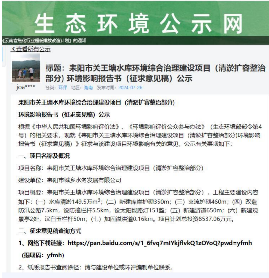
图2 征求意见稿网络公示截图1