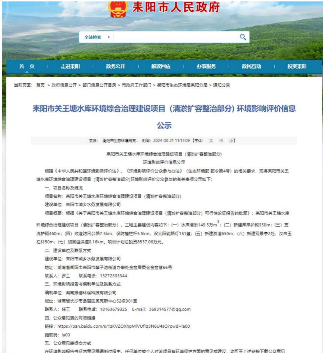
图1 第一次网络公示截图